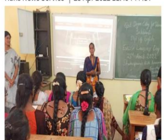
Government Degree College in Srikalahast observing English Language Day on Saturday.

Hans News Service | 23 Apr 2022 11:49 PM IST